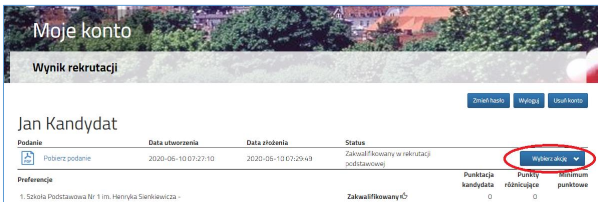
Rysunek nr 1

Po ogłoszeniu wyników kwalifikacji rodzice/opiekunowie dzieci zakwalifikowanych będą mogli złożyć potwierdzenie woli przyjęcia elektronicznie - dotyczy tylko wniosków. W tym celu należy zalogować się na konto, następnie przy wniosku dziecka zakwalifikowanego kliknąć przycisk Wybierz akcję (Rysunek nr 1).