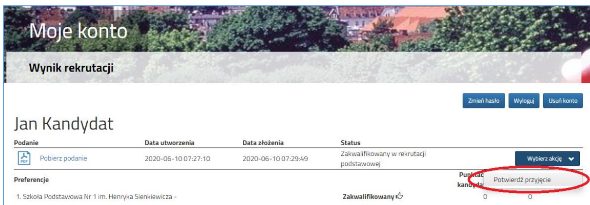
Rysunek nr 2

W kolejnym kroku należy wybrać opcję Potwierdź przyjęcie (Rysunek nr 2).